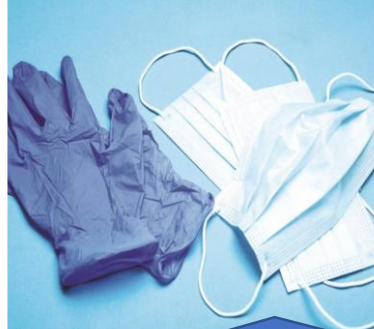
التأكد من ارتداء القفازات والكمادات