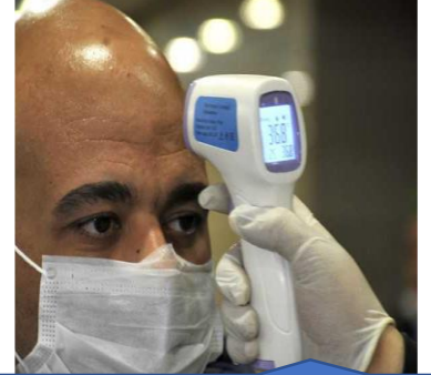
قياس درجة الحرارة